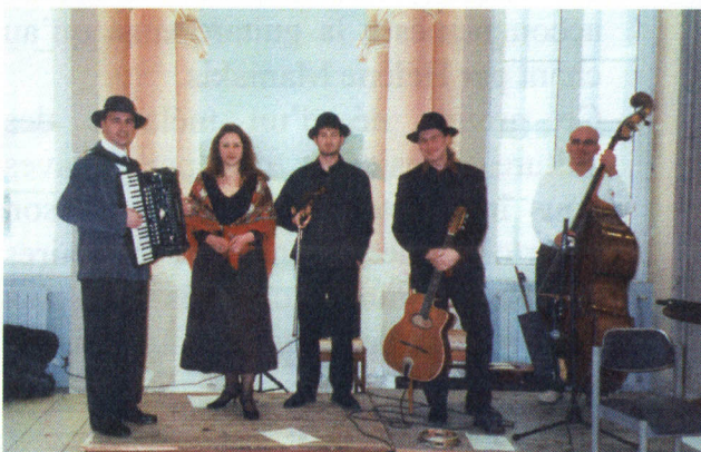
Groupe « Tchatch'oski »