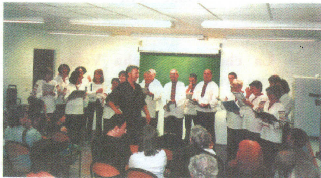
Chorale « Nacha Volga »